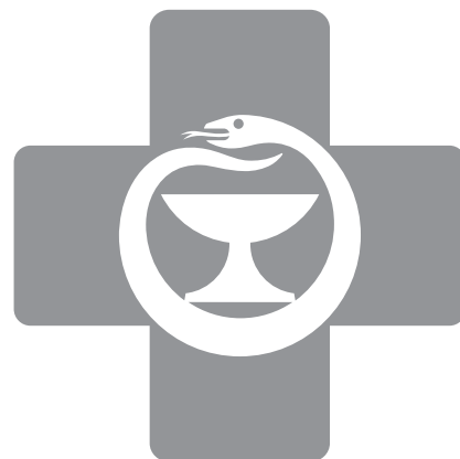
Mustavalkoinen musta 50 % rasteri